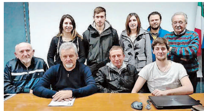
VERNASCA - Il consiglio direttivo della Pubblica assistenza

Onori di casa dal nuovo direttivo di Vernasca