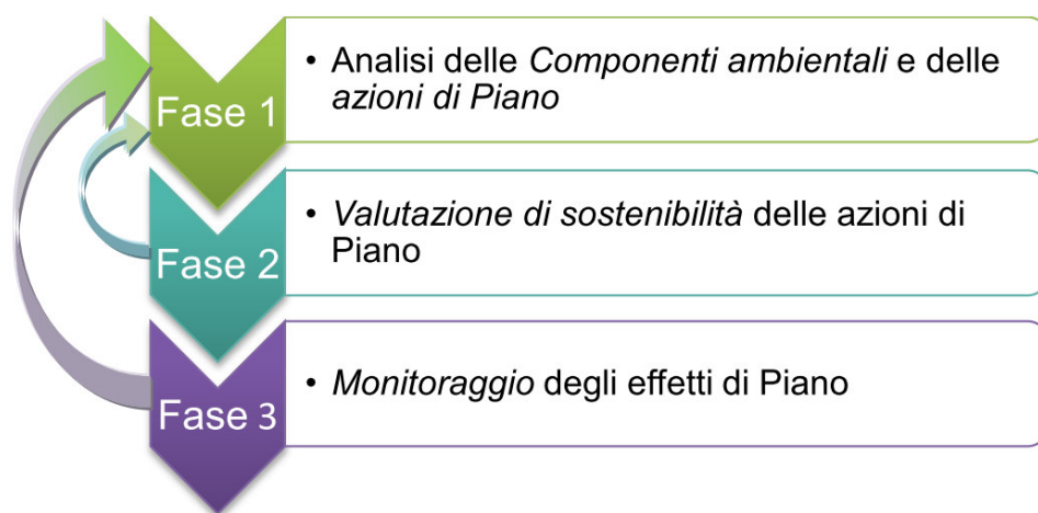
Figura 0.5.1 - Schema metodologico della ValSAT del RUE.